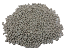
デオックス サシェ