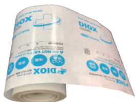
徐放機能付専用包装紙