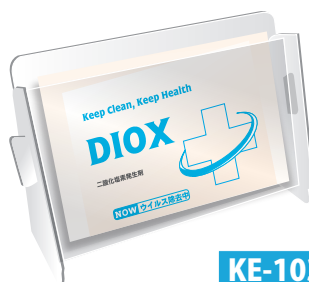
デスク デオックス